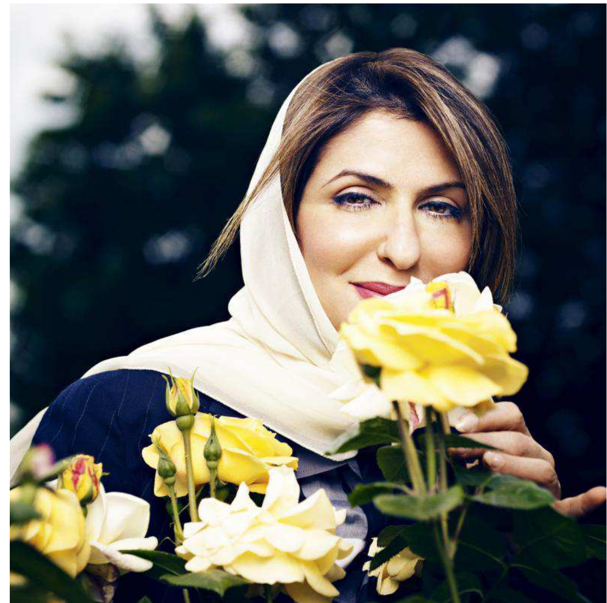
La princesa Basmah bint Saud en el jardín de su casa en Londres.

Basmah dejó su país hace algo más de un año para instalar su púlpito en el oeste de Londres, con sus cinco hijos. Divorciada desde 2007, se dedicó a los negocios en Arabia Saudí y ahora expande su cadena de restaurantes en Inglaterra, al mismo tiempo que despliega una frenética actividad en favor de los Derechos Humanos y las reformas en su país. «La independencia que tengo aquí me da libertad para hacer lo que quiera, escribir mi blog y mis publicaciones, viajar por todo el mundo y relacionarme con organizaciones que comparten mi objetivo: mejorar la vida de los ciudadanos de mi país. No quiero ser ministra ni fundar un partido político», afirma la princesa, arremolinada en el sofá de su sala de →